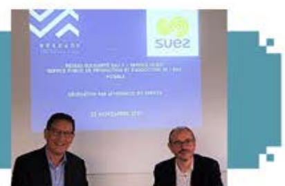
Signature du contrat de concession avec la société Suez

L'exploitation des infrastructures du Service Ouest a récemment été confiée à la société Suez à partir du 1er Janvier 2022 sur la base d'un contrat de concession de 3 ans.