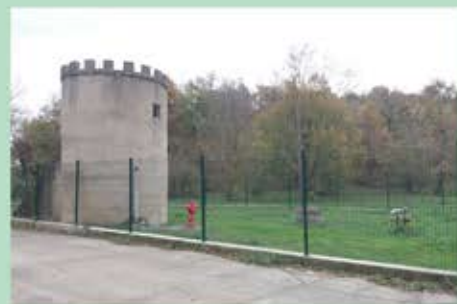
Usine de Roquetaillade

L'objectif est ici de disposer d'un même niveau d'équipement sur l'ensemble des ouvrages du périmètre afin de garantir une exploitation optimale.