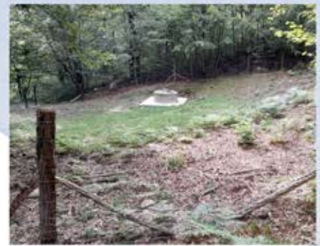
Source du Linon et son périmètre de protection immédiate

Des travaux de protection seront également menés sur les captages d'eau situés sur les communes de Citou et Capendu en 2022.